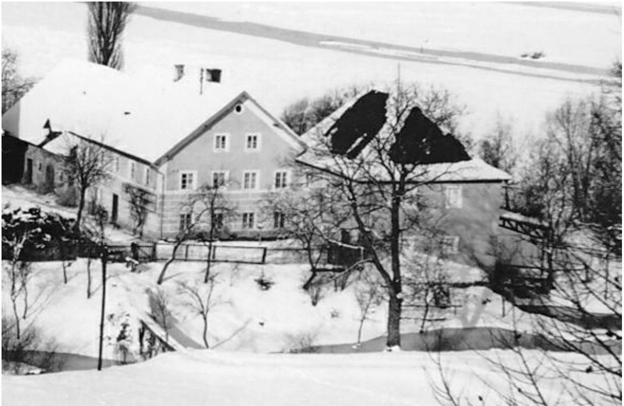
Die Eiermühle um 1937